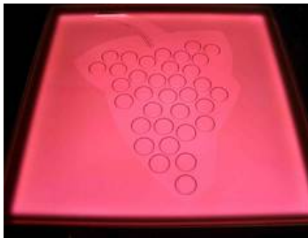
Glasfliese mit LED-Beleuchtung