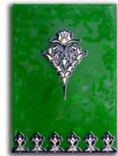
Glaskachel mit Blattgoldeinschmelzung und klassischen arabischen Ornamenten