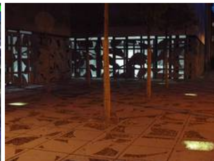
Verschmolzener Glaskies, hinterleuchtet in einer Außenanwendung