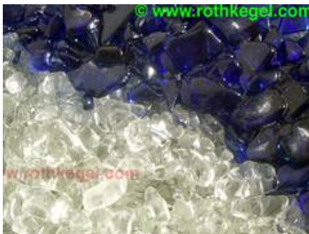
Verschmolzener Glaskies im Detail