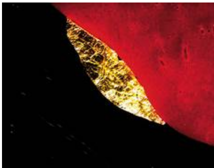
Detailaufnahme einer Blattgoldeinschmelzung