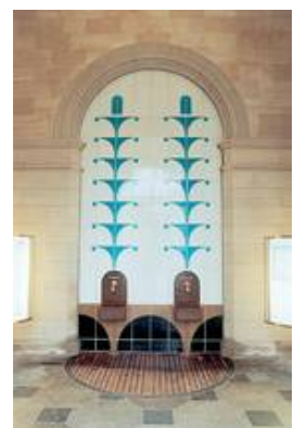
Wandelhalle Bad Kissingen Glasfliesen nach dem Entwurf von Florian Leitl