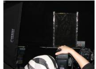
Mittelformatkamera und die digitale Spiegelreflexkamera ermöglichen sinnvolle Dokumentationen in jedem gewünschten Umfang.

Es empfiehlt sich Einzelbilder von jedem Glasmalereifeld eines Fensters im Vorzustand nach Ausbau in der Werkstatt unter verschiedenen Beleuchtungssituationen (Auflicht und Durchlicht) vorzunehmen, um den ursprünglichen Zustand festzuhalten. Ein eben solches Foto im frisch restaurierten Nachzustand bewahrt diesen erzielten Zustand in der Dokumentation für nachfolgende Generationen.