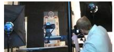
Unsere professionelle Hensel Studioblitzanlage sorgt für das richtige Licht unabhängig vom Tageslicht und für vergleichbare Abbildungen.