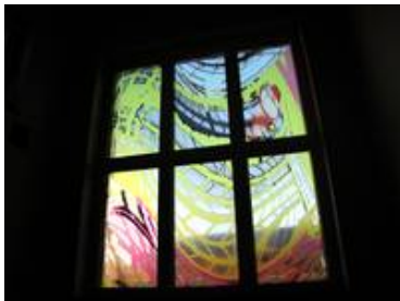
Das obere Fenster an einem späten Sommernachmittag