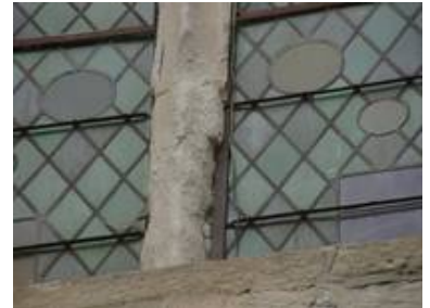
Die Steinschäden an der Schlosskapelle waren erheblich; gut zu erkennen auch die Aufteilung der Bleifelder und die ursprünglichen Orte der Glasmalereischeiben.