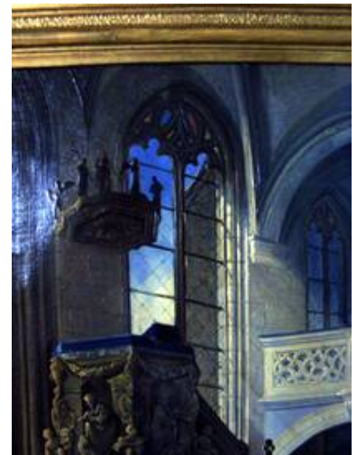
Dieses Gemälde dokumentierte deutlich die ursprüngliche Verglasung.