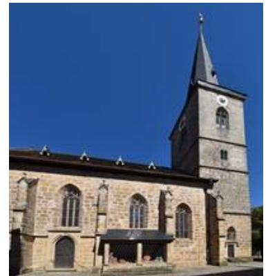
Ein Teil der Südseite der kath. Kirche St. Johannes der Täufer zu Seßlach mit den Fenstern sVII, sVI und sV (v.l.n.r.). In sVI und sV wurden Bleiverglasungen als ASV eingesetzt