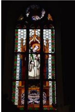
Bei der Gesamtbetrachtung im Durchlicht von innen fällt kaum etwas auf