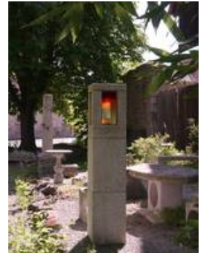
Steinstele mit Fusingarbeit als Abdeckung einer Kerze