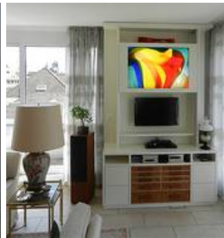
Kaschierung eines Fernsehers (hochgeschoben)