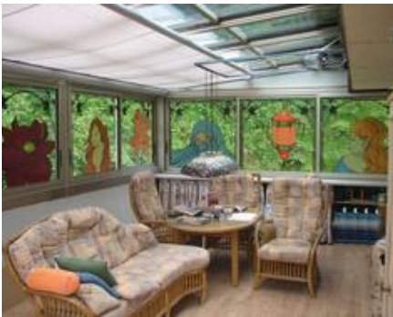
Gestaltung einer Wintergartenverglasung nach Kundenwunsch