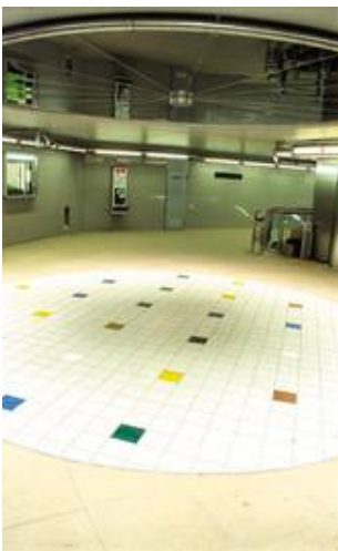
Deckenfliesen aus Glas