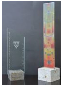
Tischstelen als Präsentationsstücke