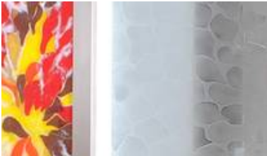
Abstraktes Bild in Fusingtechnik in Kombination mit Sandgestrahlten Türscheibe

Hier zeigen wir Ihnen, dass gestaltetes Glas viele Gesichter hat, mit Sicherheit ist auch eines dabei das Ihnen gefällt.