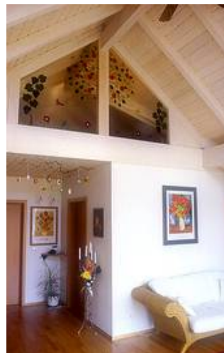
Dachraumabtrennung aus Fusingglas