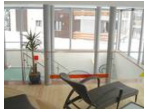
Glasbrüstung mit Fusingapplikationen