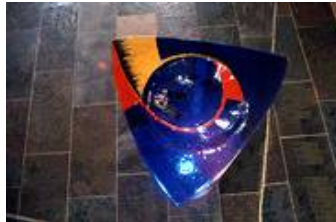
Taufschale aus Fusingglas