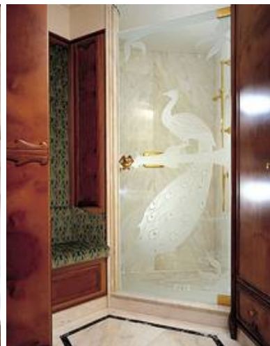
Duschtür mit Sandstrahlung