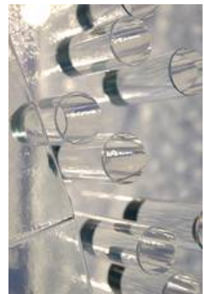
Fusing-Klebearbeit in einem Wandbild