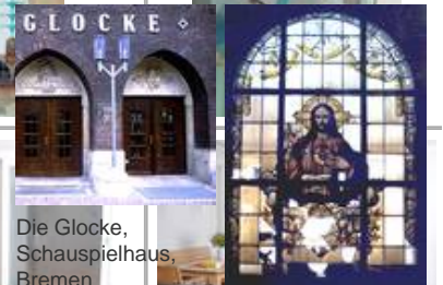
Die Glocke, Schauspielhaus, Bremen Standaußenleuchten WB 85/SL 2-1 mit Sondermast Kath. Kirche Sulzbach, sV Herz-Jesu vor der Restauration