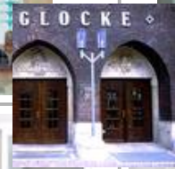
Die Glocke, Schauspielhaus, Bremen Standaußenleuchten WB 85/SL 2-1 mit Sondermast

Kath. Kirche Itzehoe Halogenkronleuchter KR 94-4/H 1-50/12-12