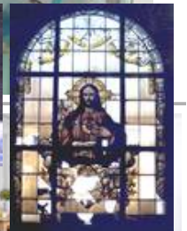
Kath. Kirche Sulzbach, sV Herz-Jesu von der Restauration