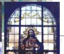
Die Glocke, Schauspielhaus, Bremen Standaußenleuchten WB 85/SL 2-1 mit Sondermast Kath. Kirche Sulzbach, sV Herz-Jesu vor der Restauration