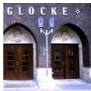
Die Glocke, Schauspielhaus, Bremen Standaußenleuchten WB 85/SL 2-1 mit Sondermast