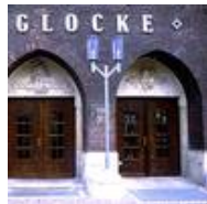
Die Glocke, Schauspielhaus, Bremen Standaußenleuchten WB 85/SL 2-1 mit Sondermast