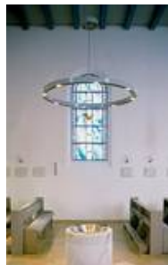
Kath. Kirche Itzehoe Halogenkronleuchter KR 94-4/H 1-50/12-12