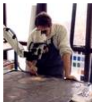
Voruntersuchung am Mikroskop