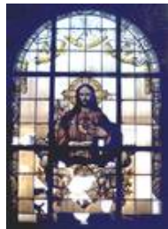
Kath. Kirche Sulzbach, sV Herz-Jesu vor der Restauration