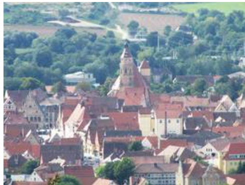
St. Andreas prägt das Stadtbild von Weißenburg

1425 wird dieser Bauabschnitt, der spätgotische Chor, fertiggestellt. Da aber nun das Geld ausgeht, verbindet man diesen Chor mit dem vorhandenen Langhaus. So erhielt St. Andreas seine charakteristische Form, die im Laufe der Jahrhunderte durch weitere An- und Umbauten zum heutigen Gesamtbild führte.