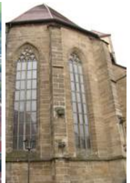
Die ASV von nII und nIII

Der Hauptbestandteil des Restaurierungskonzeptes sah vor, die Chorfenster mit einer innenbelüfteten Außenschutzverglasung (ASV) zu versehen. Erst durch eine vom Innenraum aus hinterlüftete ASV können die Glasmalereien wirkungsvoll konserviert werden und moderne Konservierungsmöglichkeiten sinnvoll eingesetzt werden.