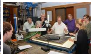
Besprechungen mit dem Fachgremium sind ein wichtiger Meilenstein der Maßnahmen