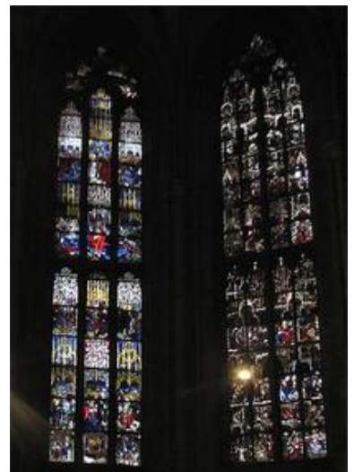
Die Fenster OI und SII

Mit seinem 161,53 m hohen Turm - dem höchste Kirchturm der Welt - gehört das Münster zu Ulm wohl in den Kreis der berühmtesten Kirchen der Welt. Es beherbergt viele bedeutende Kunstwerke des Spätmittelalters.