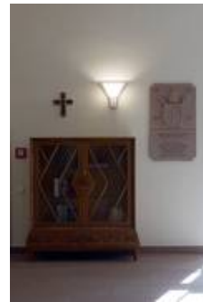
WS 09/W 10 T

So verbindet sich moderne, energiesparende Technik mit zeitlosem Design. Gerne beraten wir Sie auch in Ihrem Projekt.