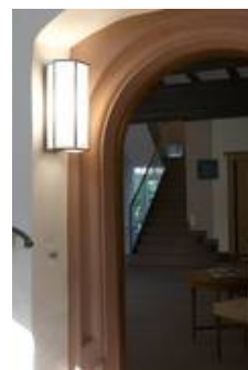
WS 09/W 14 T