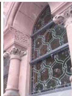
Eines der Feuersteinfenster unter den seitlichen Emporen mit Schutzverglasung im Nachzustand