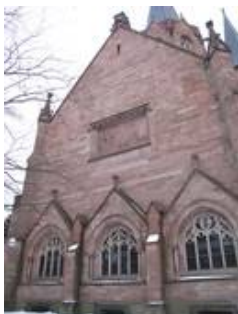
Neben den mächtigen Glasmalereifenstern im Kirchenraum gibt es in der Christuskirche eine Vielzahl weiterer Fenster