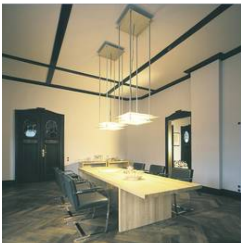
WM 02/DP 6-4 H in einem Besprechungsraum