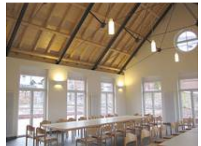
Manufakturleuchten WM 09/P 1 T und WM 94/W 3-2 T im Gemeindesaal in Wenigumstadt

Weitere Informationen zum Thema sinnvolle Beleuchtung finden Sie auch in den Bereichen energieeffiziente Beleuchtung und Lichtplanung .