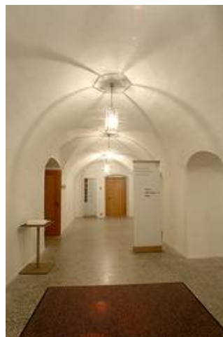
WB 79P 11 im Liechtensteinischen Landesmuseum in Vaduz