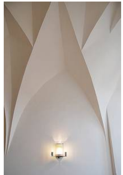
Mit zusätzlichen hochenergetischem Strahler weiterentwickelte Wandleuchte WM 03/W 1T-2 g in der Dompropstei zu Meissen