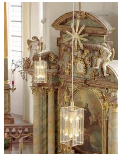
Würzburger Bleileuchten WB 07/P 2-9 hier in Messing in der kath. Kirche Weilbach