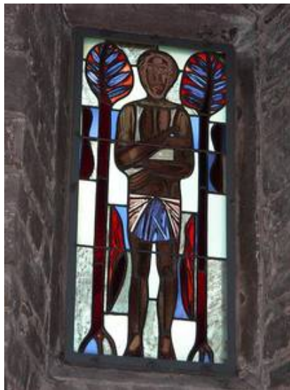
Das gleiche Fenster von Innen im Vorzustand Und im Nachzustand