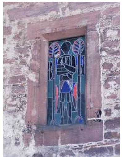
Ein Fenster im Vorzustand