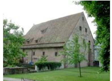
Von Aussen ist St. Aurelius ein unscheinbares Gebäude

Eben jene neun Glasfenster wurden von uns mit einer innenbelüfteten Aussenschutzverglasung versehen; die Glasmalereien wurden restauriert. Auf Grund der besonderen Einbausituation war auch hier eine Sonderlösung für die Schutzverglasung gefragt.