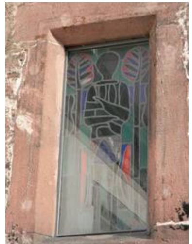
Das gleiche Fenster im Nachzustand mit Schutzverglasung