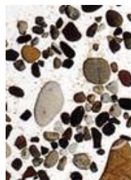
Kieselsteine in Glas