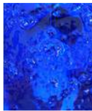
Links die Durchsicht durch blaues Fusingglas mit Glaskröseln, rechts ist auf das Glas eine Scheibe auflaminiert, dadurch erhöht sich die Durchsicht