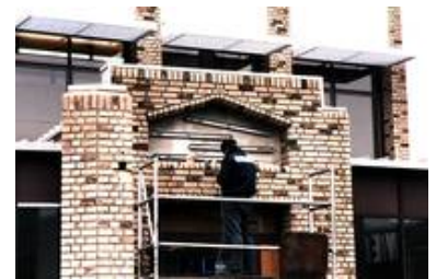
Auch die Hinterleuchtung der Glasgestaltung kann von uns ausgeführt werden