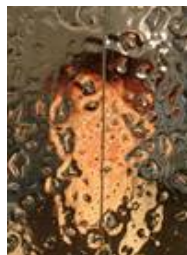
Links die Durchsicht durch weißes Fusingglas mit Glaskröseln, rechts ist auf das Glas eine Scheibe auflaminiert, dadurch erhöht sich die Durchsicht