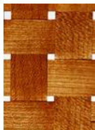
Holzgeflecht in Glas