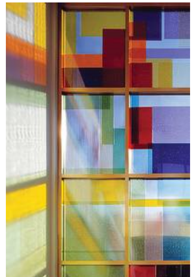
Ausschnitt aus dem großen Fenster der LZB in Meinigen, Architekturbüro Prof. Kollhoff, Entwurf: Prof. Federle