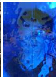
Links die Durchsicht durch blaues Fusingglas ohne Glaskröseln, rechts ist auf das Glas eine Scheibe auflaminiert, dadurch erhöht sich die Durchsicht