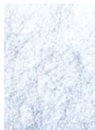
Vlies in Glas