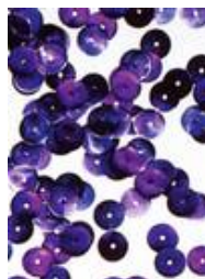
Stanzronden in Glas