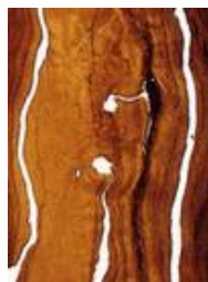
Furnier in Glas