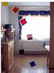
Auf Sicherheitsglas auflaminierende Fusingsscheibe, dadurch erhöht sich die Durchsicht