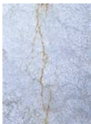
Marmor in Glas