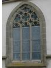
Die Aussenschutzverglasung in Bad Wimpfen im Vorzustand

Weitere Auskünfte erteilen wir gerne auf Anfrage .