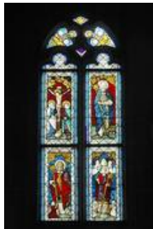
nVI datiert auf 1500/1530 (Becksmann 1986 S. 329ff)