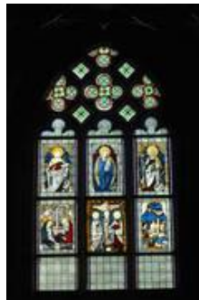
sV datiert auf 1500/1530 (Becksmann 1986 S. 329ff)