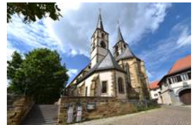
Der Chor der Stadtpfarrkirche