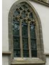
Die Aussenschutzverglasung in Bad Wimpfen im Nachzustand