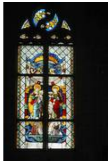
nVII datiert auf 1552 (Becksmann 1986 S. 330ff)