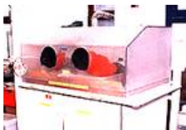
Zum Glasätzen gehört Erfahrung, wir haben sie und die entsprechende Ausrüstung - nutzen Sie diese

Entscheiden Sie selbst, ob Sie Ihren Entwurf bei uns fertigen lassen und wir der Ansprechpartner für den Bauherrn sind, oder ob Sie "nur" unsere Werkstatträume und Anlagen nutzen möchten und Arbeitshilfe bei der Ausführung benötigen.