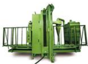
Wieso in eine neue Sandstrahlanlage investieren; arbeiten Sie als Künstler mit uns