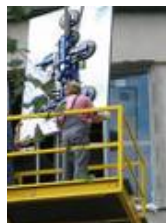
Auch beim Einbau stehen wir Ihnen als Künstler mit Rat zur Seite